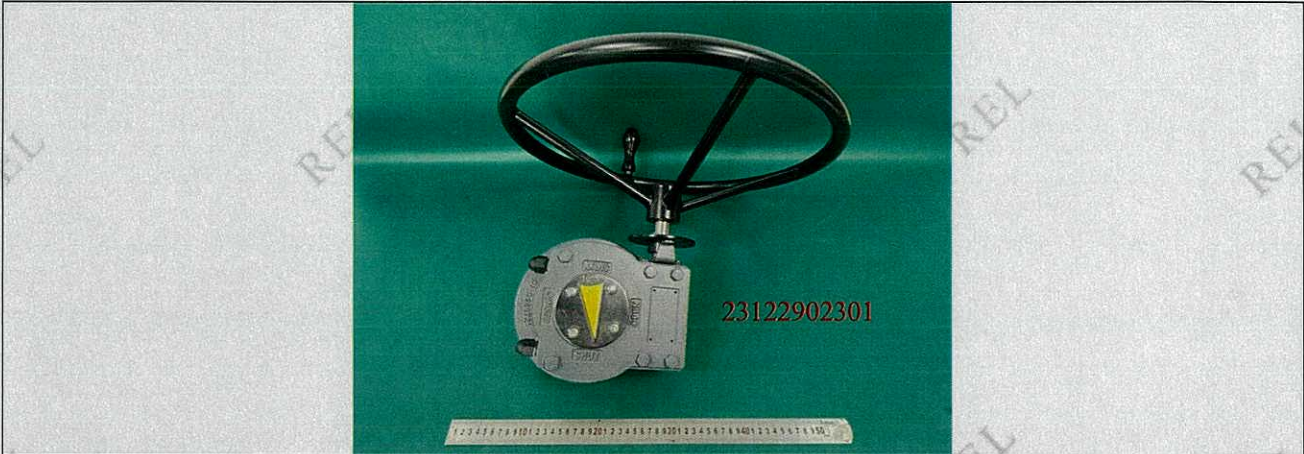
图 1 样品接收态外观代表性照片